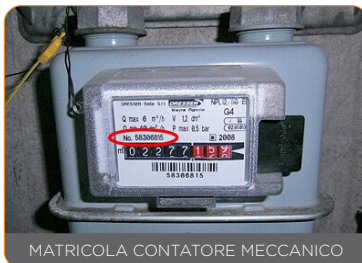
MATRICOLA CONTATORE MECCANICO

La matricola del contatore del gas è un numero che identifica univocamente l'apparato di misura. Questo significa che ogni contatore ha un numero di matricola differente rispetto ad un altro. Questo numero è assegnato in fabbrica dall'azienda produttrice del dispositivo stesso.